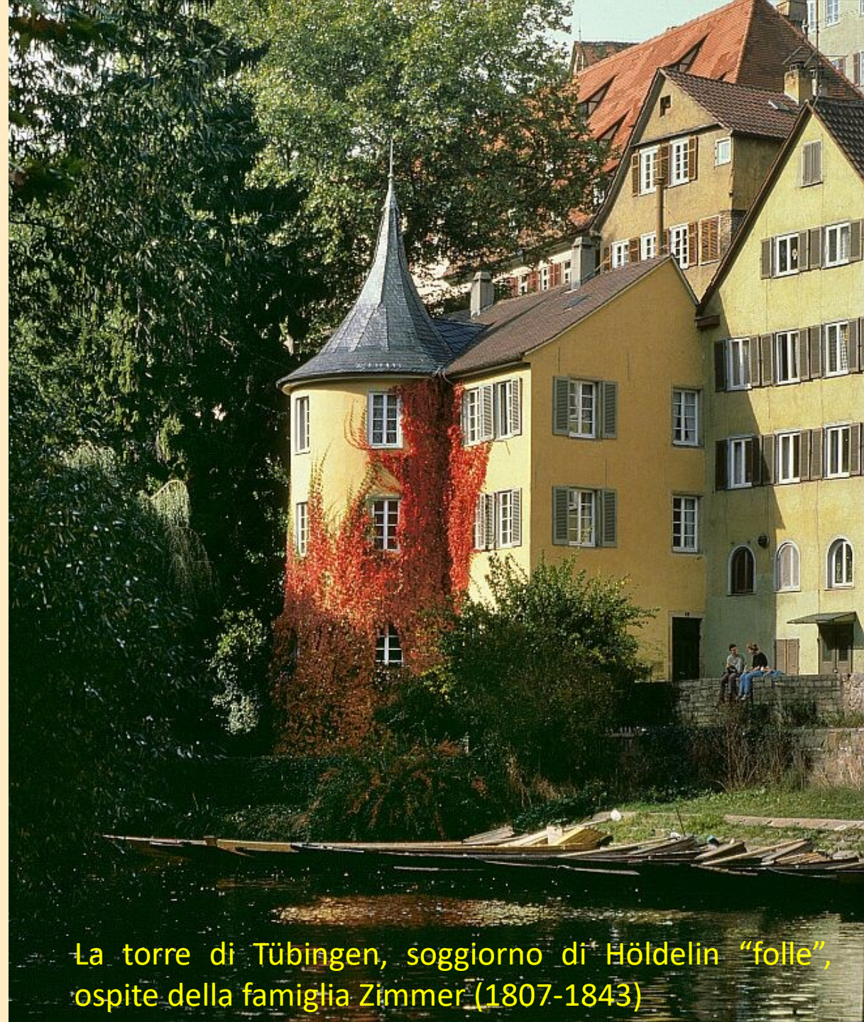
La torre di Tübingen, soggiorno di Hödelin "folle", ospite della famiglia Zimmer (1807-1843)